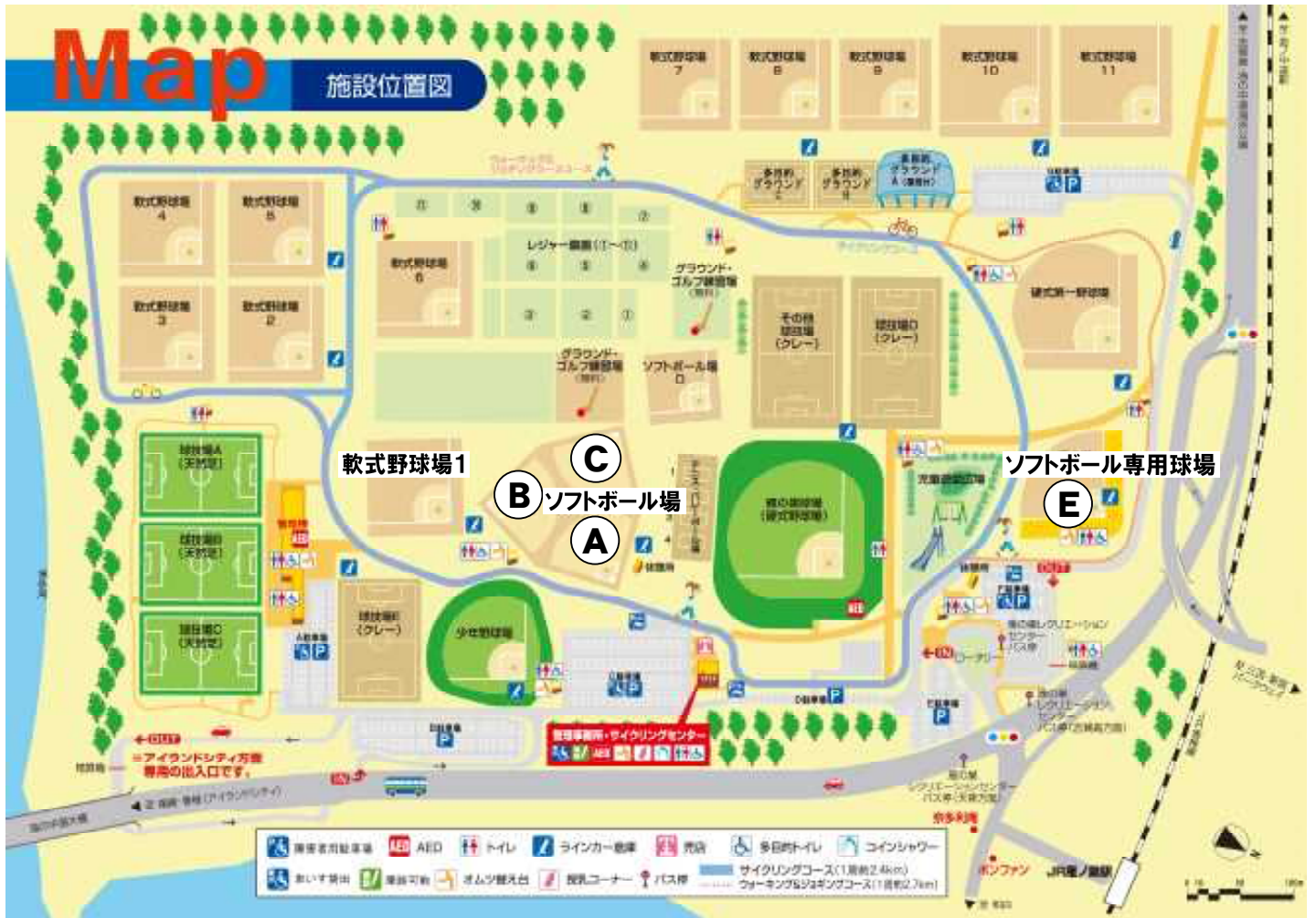
雁ノ巣レクリエーションセンター 施設マップ