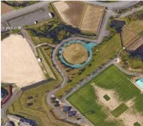
下の駐車場 30台(役員)