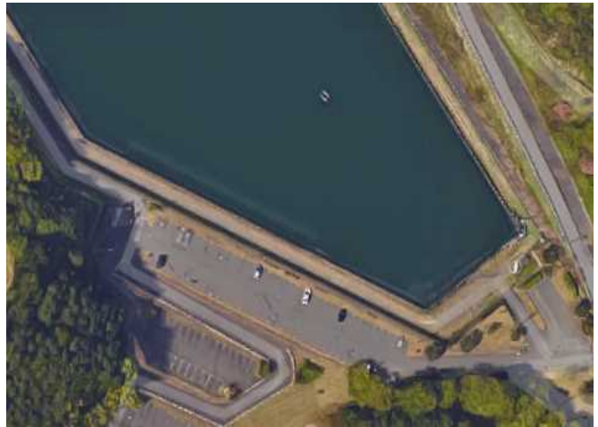
上の駐車場 100台(各チーム関係者)