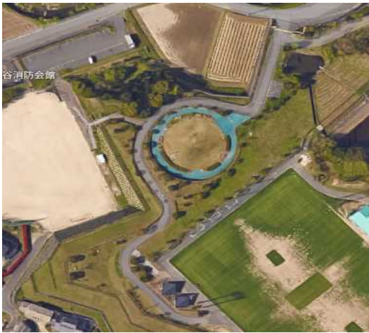
下の駐車場 30台(役員)