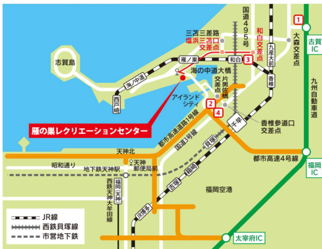
雁の巣レクリエーションセンター周辺地図