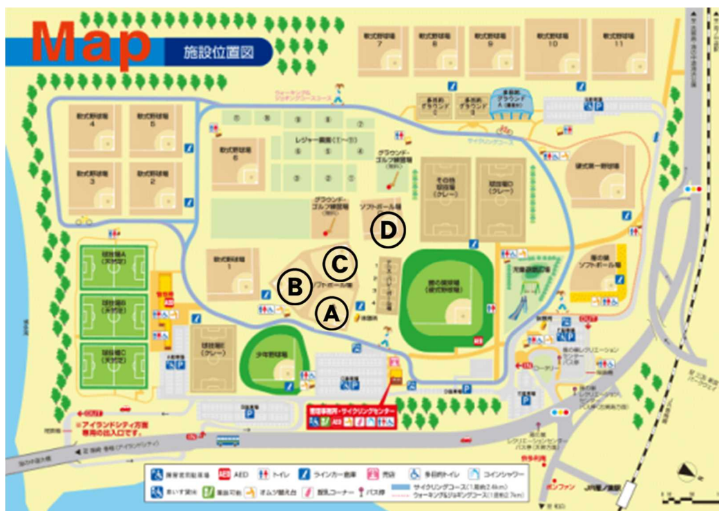
雁の巣レクリエーションセンター 施設マップ